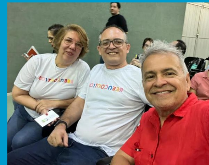
Membros da equipe da EIDEIA